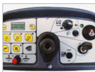
PANNELLO DI CONTROLLO INTUITIVO