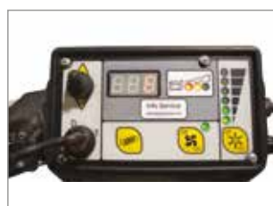
PANNELLO DI CONTROLLO INTUITIVO