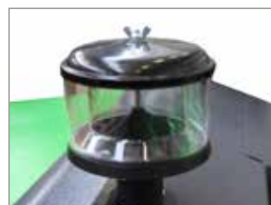
PREFILTRO CICLONICO DONALDSON