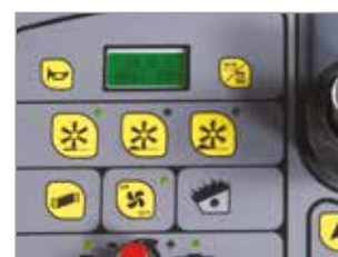
3 PROGRAMMI DI LAVORO PRE IMPOSTATI