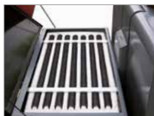
FILTRO IN TESSUTO