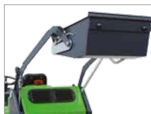
SISTEMA DI SCARICO CON PISTONE IDRAULICO