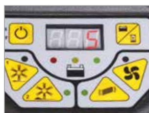
PANNELLO DI CONTROLLO INTUITIVO