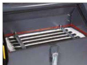
FILTRO IN TESSUTO