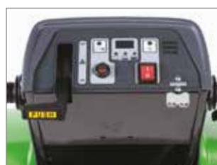
PANNELLO DI CONTROLLO INTUITIVO