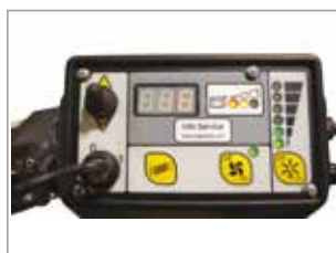
PANNELLO DI CONTROLLO INTUITIVO