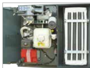
FILTRO IN TESSUTO