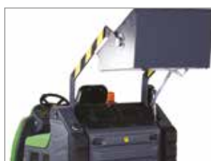
SISTEMA DI SCARICO CON PISTONE IDRAULICO