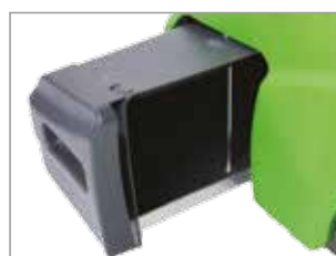
AMPIO CONTENITORE RIFIUTI ANTERIORE