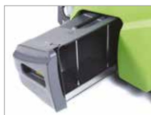
AMPIO CONTENITORE RIFIUTI ANTERIORE