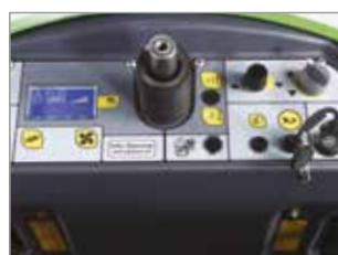
PANNELLO DI CONTROLLO INTUITIVO