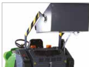
SISTEMA DI SCARICO CON PISTONE IDRAULICO