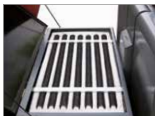
FILTRO IN TESSUTO