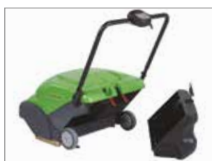
AMPIO CONTENITORE RIFIUTI